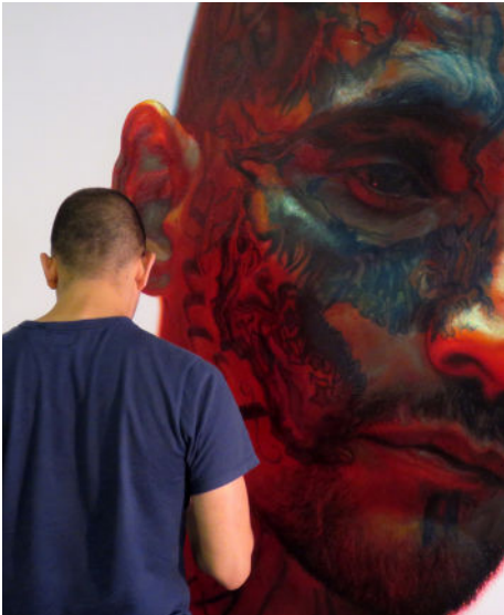
Fotografía de Vincent Valdez.

chicano y la posterior reforma policiaca. Valdez, en colaboración con la artista Adriana Corral, respondió a esta tragedia creando un monumento conformado por diferentes partes dentro de la exposición. Valdez y Corral han trabajado para combinar elementos naturales provenientes de The Hole, un sitio ubicado a lo largo del Buffalo Bayou en Houston, famoso por las palizas policiales, los interrogatorios y la muerte de Torres.