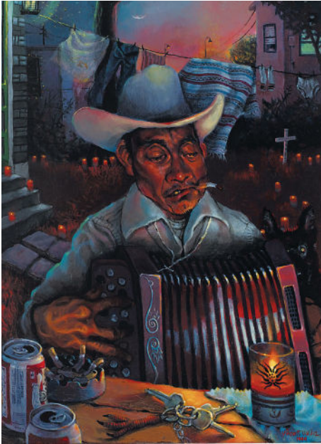
Vincent Valdez, Recuerdo , 1999. Óleo sobre tabla.